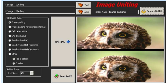
HDMI 3D Pattern BMP 圖檔專用編輯軟體 - 格式轉換 此處範例為 Fram Packing 的格式