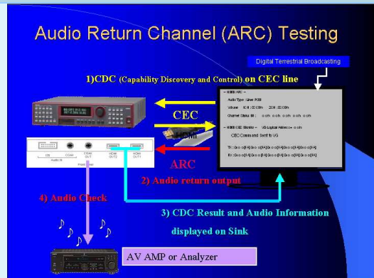
ARC 測試功能示意圖，測試結果直接顯示在 TV