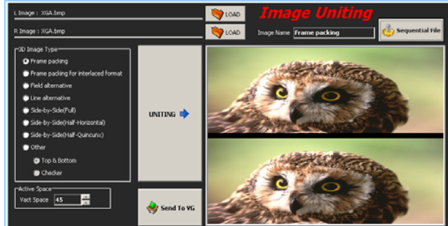
HDMI 3D Pattern BMP 圖檔專用編輯軟體 – 格式轉換此處範例為 Fram Packing 的格式