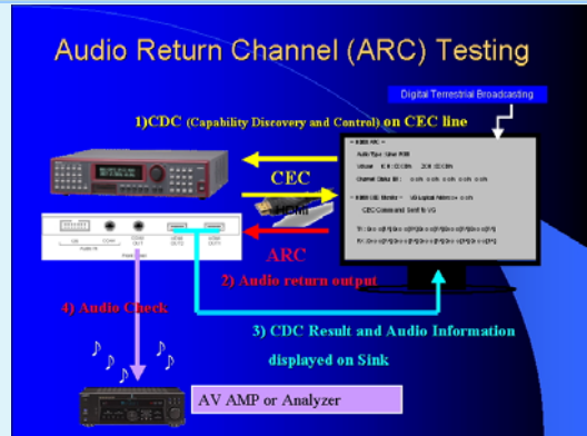
ARC 測試功能示意圖，測試結果直接顯示在 TV